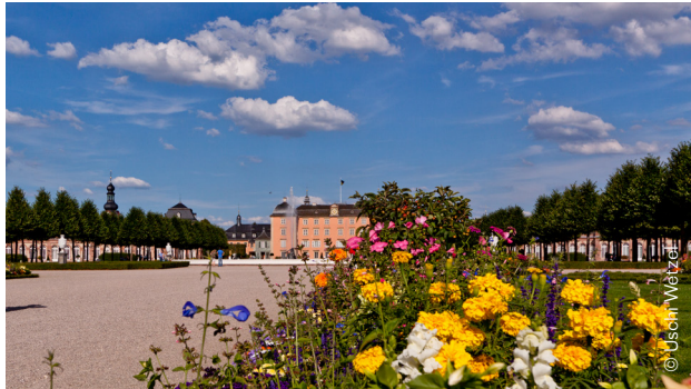
Schloss und Schlossgarten Schwetzingen

„Rendez-vous aux jardins“ wird in Frankreich vom französischen Ministerium für Kultur (Generalabteilung Kulturerbe, Regionaldirektionen für kulturelle Angelegenheiten), in Zusammenarbeit mit dem Komitee für Gärten und Parkanlagen in Frankreich, der Organisation „Demeure Historique“, der Vereinigung „Vieilles Maisons Françaises“, dem Zentrum für staatliche Denkmäler und allen privaten und öffentlichen Eigentümern organisiert.